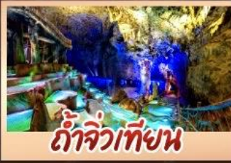
ถ้ำจิวเทียน