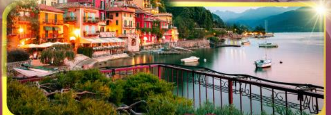
ทะเลสาบโลโบ