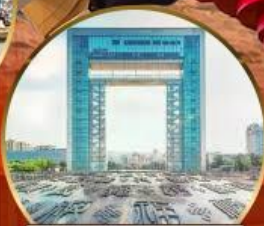
ประตูแห่งความสุข

山東航空公司 SHANDONG AIRLINES SC4080 02.05-08.05 SC4079 21.50-01.55 เดินทางด้วยสายการบิน Shandong Airline (SC) น้ำหนักกระเป๋า 23 Kg. Carry on 5 Kg.