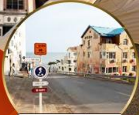
ถนนอ่าวจีปา