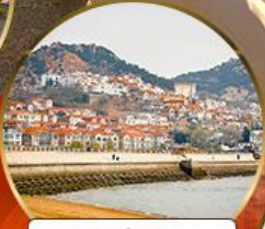
ซาจี้โข่ว