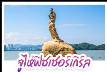
จูเซีฟิซเซอร์ทึกรึค