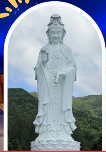
วัดซีซัน