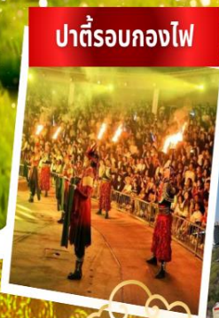
ปาร์ตี้รอบกองไฟ