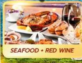
SEAFOOD + RED WINE