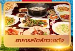
อาหารสไตล์กวางตุ้ง