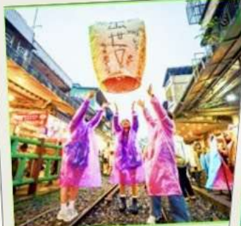
ปล่อยโคมลอย