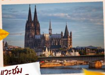
แวะชม มหาวิหารโคโลญ