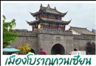
เมืองโบราณทวนเซี่ยน

ภูเขาสี่ดรุณี - อุทยานπίงผิงโกว - สะพานหนานเฉียว - ร้านหนังสือจงซูเก๋ - เมืองโบราณกวนเสียน จตุรัสเทียนหู่ - พิพิธภัณฑ์ชาฟี่ - ถนนโบราณชอยกว้างชอยแคบ - ถนนคนเดินไท่กู๋หลี่ ถนนคนเดินซุนซี - ถนนโบราณจินหฺสึ - พิพิธภัณฑ์เปิ่นตีก - น้ำพุไม้ไฟตีกSKP - วัดต้าฉือ