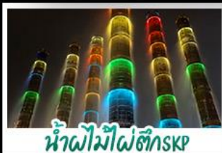
น้ำพุไม้ไฟตีกSKP