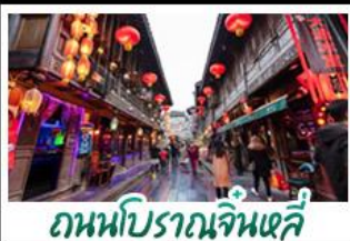
ถนนโบราณจินหฺสึ