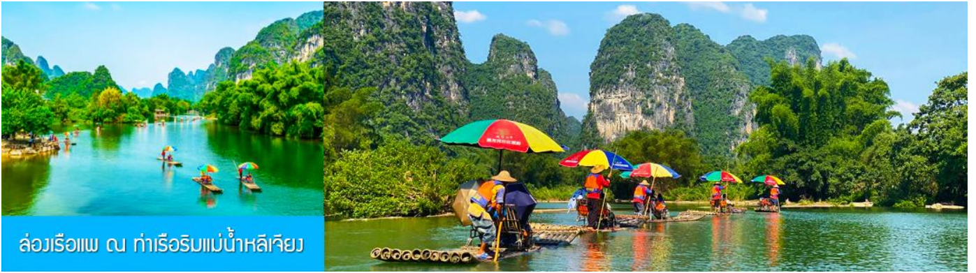
ล่องเรือแพ ณ ท่าเรือริมแม่น้ำหลิเจียง