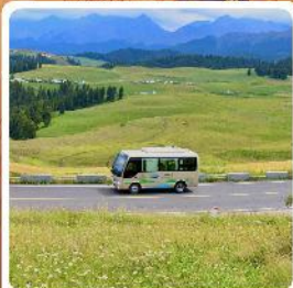
ทุ่งหญ้าเจียนปูลาเค่อ