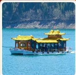
ล่องเรือทะเลสาบเทียนจื่อ