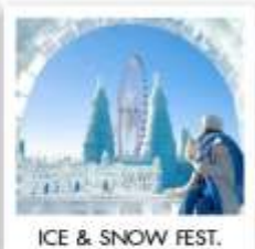
ICE & SNOW FEST.