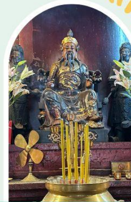
วัดปุกโตฮองฮำ