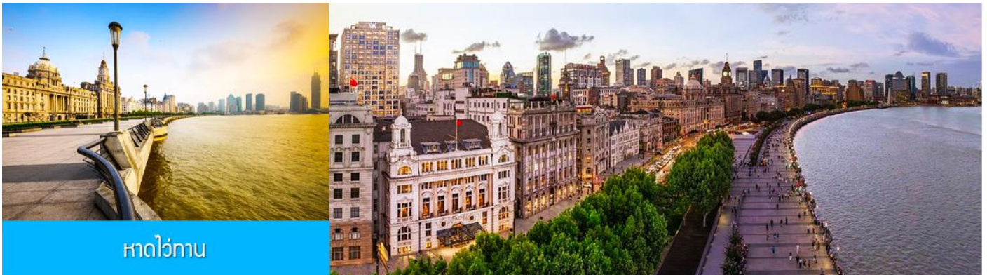
หาดว่อกาน

จากนั้นนำท่านเดินทางโดยรถบัสสู่นครเซี่ยงไฮ้ (ระยะทาง 200 กม. ใช้เวลาเดินทางราว 3 ชั่วโมงเศษ)