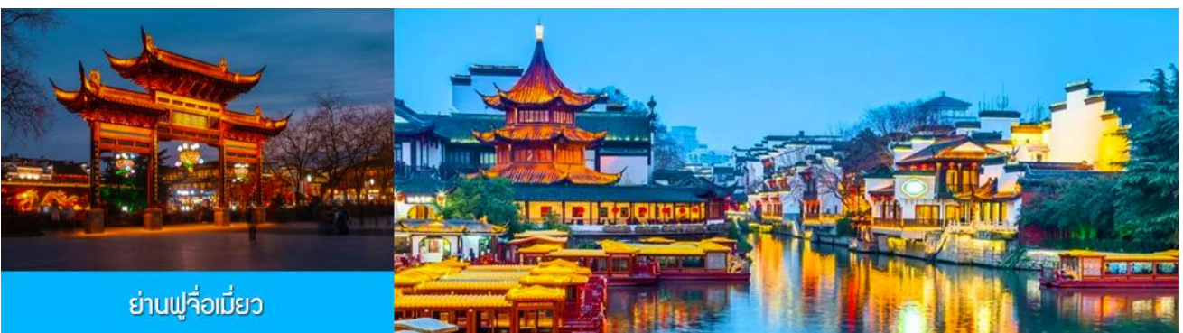
ย่านฟูจื่อเมี่ยว