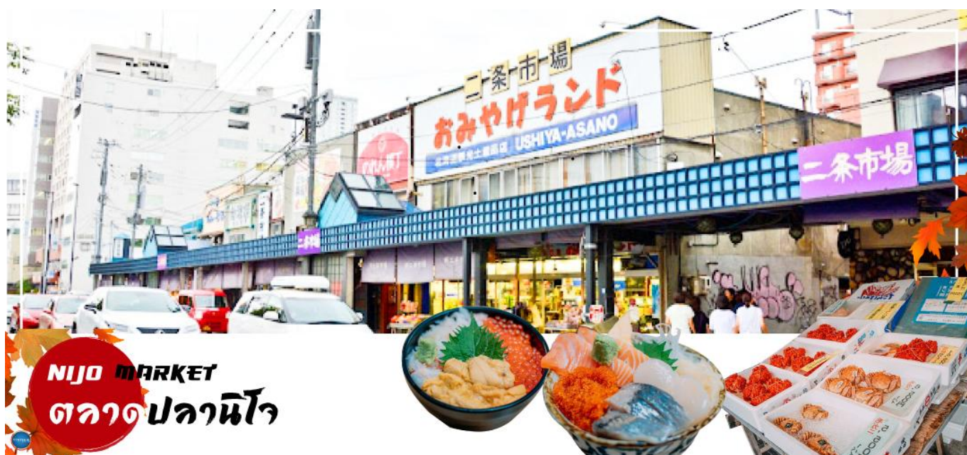
NIJO MARKET ตลาดปลาโนโจ

จากนั้นนำท่านเดินทางสู่ เมืองซัปโปโร (SAPPORO) (ใช้เวลาเดินทางประมาณ 1 ชั่วโมง) เพื่อนำท่านสู่ ตลาดปลาโนโจ (Nijo Market) ตลาดปลาใจกลางเมืองซัปโปโร แม้มิขนาดใหญ่โตแต่ด้วยที่อยู่กลางเมือง เดินทางสะดวกและสินค้าครบครัน เป็นที่นิยมของนักท่องเที่ยวญี่ปุ่นและต่างชาติจำนวนมาก ตลาดปลาแห่งนี้ประกอบด้วยร้านจำหน่ายอาหารทะเลสดๆ ร้านจำหน่ายสินค้าแปรรูป ต่างๆ ห้ามพลาด!!! สำหรับผู้ที่ชื่นชอบรสชาติของปูชนยักษ์ อันเลื่องชื่อแห่งเกาะฮอกไกโด ที่ตลาดแห่งนี้ท่านจะเห็นปูชนตัวเป็นๆ วายน้ำในตู้ ที่ต้องบอกว่าราคาไม่แพง หรือ จะเป็น หอยเชลยช่าง ที่ทานกับโชยุ นอกจากนี้ ยังมีร้านอาหารที่อยู่ด้านหลังผ้ามานใสๆ กันจก หากท่านอยากทานอาหารปรุงสุก สดใหม่ก็สามารถออเดอร์ด้านหน้าและเข้าไปรอนั่งรับประทานด้านหลังได้เลย ก่อนจะอ้อมกันยังมีเมล่อนสีส้มหวานฉ่ำ ที่มาทานปิดท้ายอีกด้วย