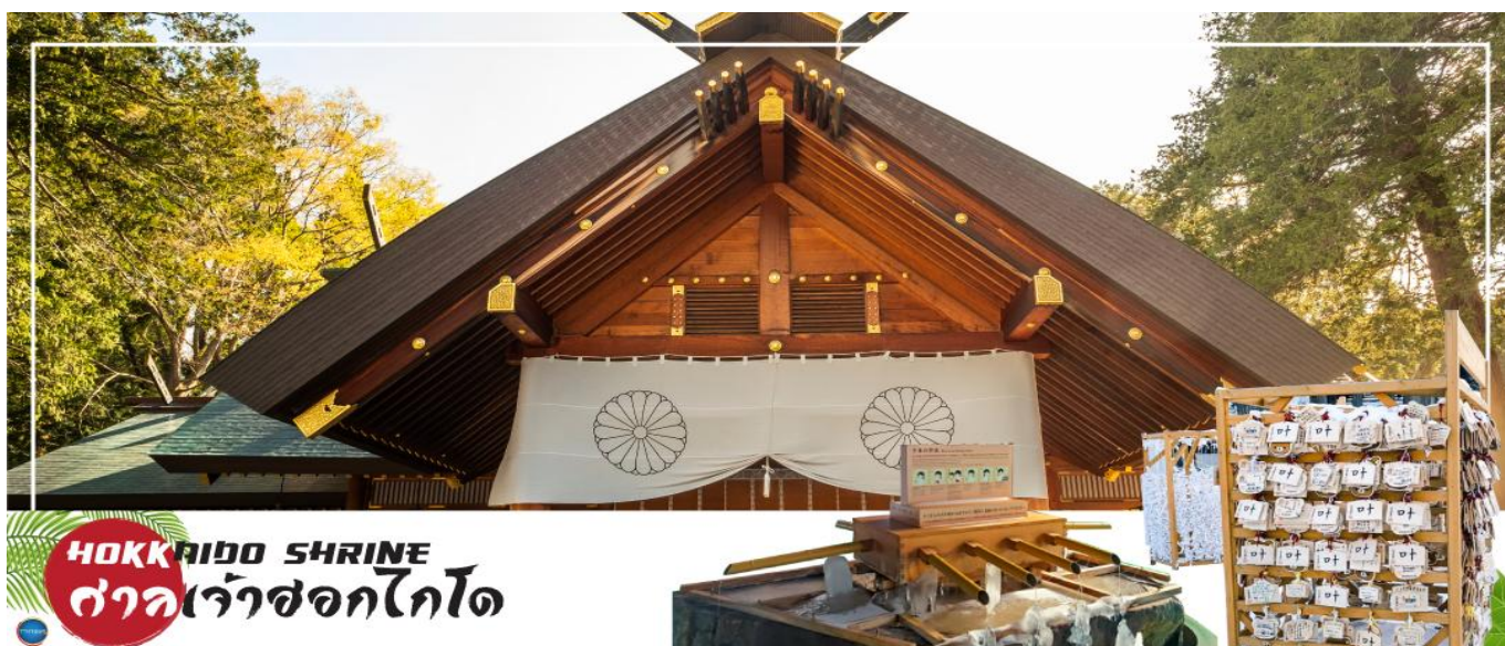
HOKKAIDO SHRINE ศาลเจ้าฮอกไกโด

นำท่านขอพร ศาลเจ้าฮอกไกโด (Hokkaido Shrine) หรือเดิมชื่อ ศาลเจ้าซัปโปโร เปลี่ยนเพื่อให้สมกับ ความยิ่งใหญ่ของเกาะเมืองฮอกไกโด ศาลเจ้าชินโตนี้คอยปกป้องรักษาให้ชนชาวเกาะฮอกไกโดมีความสุขถึงแม้จะไม่ได้มีประวัติศาสตร์อันยาวนาน