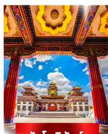
วัดโพธิ์สัตว์