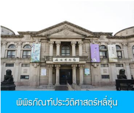
พิพิธภัณฑสถานประวัติศาสตร์หลี่ซุ่น

นำท่านเที่ยวชมและเก็บภาพ ณ สถานีรถไฟหลี่ซุ่น 旅顺火车站 เป็นสถานีปลายทางของเส้นทางรถไฟสาขา เส้นหยาง - ต้าเหลียน สร้างขึ้นในปีค.ศ. 1903 ออกแบบโดยสถาปนิกชาวรัสเซีย เป็นอาคารอิฐก่อปูนผสม โครงสร้างไม้ตามสถาปัตยกรรมรัสเซีย.