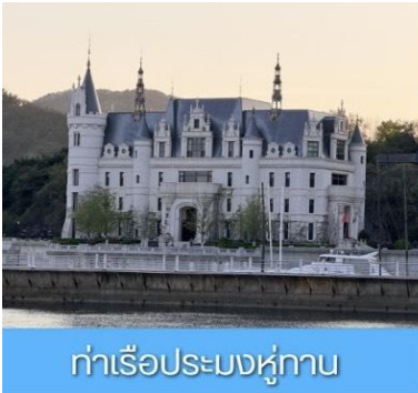
ท่าเรือประมงหู่กาน

พักที่ DALIAN JUZISHUIJING HOTEL หรือ โรงแรมระดับ 4 ดาวท้องถิ่น เมืองต้าเหลียน