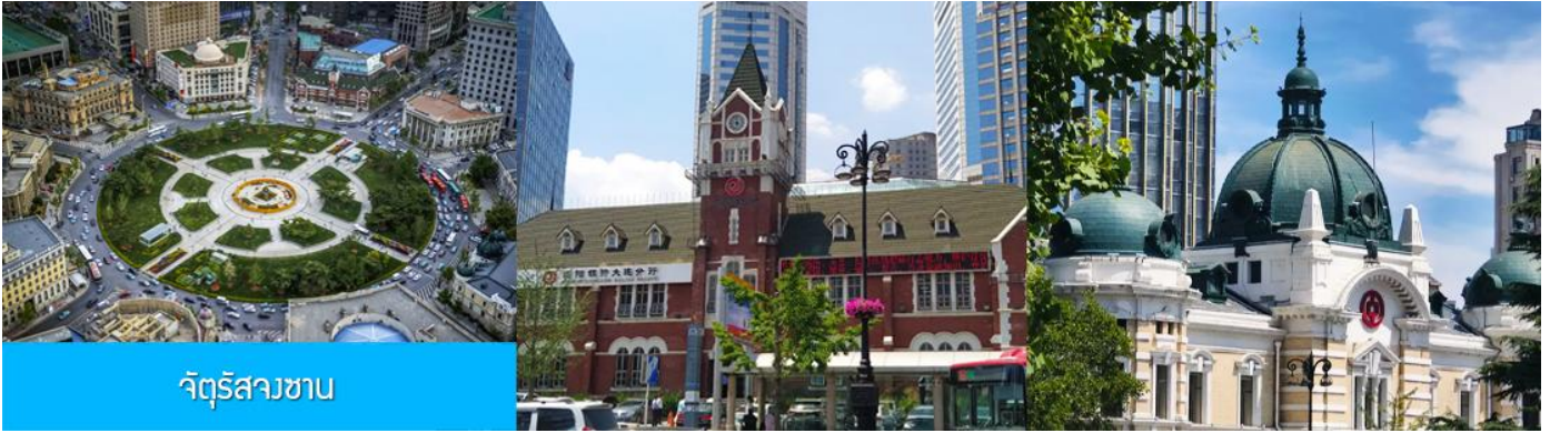
จัตุรัสวงเวียน