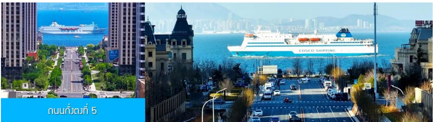
ถนนกว้างที่ 5

จากนั้นนำท่านเที่ยวชม สวนน้ำเมืองเวนิสตะวันออก 大连东方威尼斯城 เป็นเมืองเวนิสจำลองที่ถูกสร้างขึ้นด้วยทุนกว่า 8,000 ล้านดอลลาร์ ออกแบบโดยบริษัท ARC จากประเทศฝรั่งเศส โดยจำลองผังเมืองเวนิสในประเทศอิตาลี บนพื้นที่กว่า 400,000 ตารางเมตร ประกอบด้วยคลองเวนิสและอาคารที่มีสถาปัตยกรรมแบบตะวันตกกว่า 200 หลัง มีบริการล่องเรือคอนโดล่าแก่นักท่องเที่ยว นำท่านเดินชม ถ่ายภาพที่ระลึกท่ามกลาง