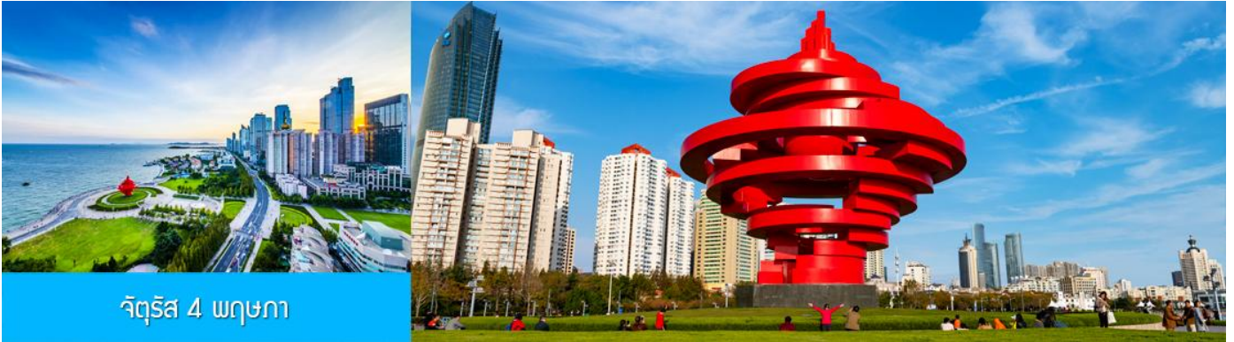
จัตุรัส 4 พฤษภาคม

จากนั้นนำท่านเดินเที่ยวชม จัตุรัส 4 พฤษภาคม May Fourth Square แลนด์มาร์กสำคัญริมอ่าวของเมืองชิงเต่า สถานที่แห่งนี้เป็นจุดที่ชาวเมืองออกมาเดินขบวนเรียกร้องอิสรภาพจากการปกครองของเยอรมัน เมื่อวันที่ 4 พฤษภาคม ค.ศ. 1919 หลังจากตกอยู่ภายใต้การปกครองมานานกว่า 10 ปี ปัจจุบันจัตุรัสแห่งนี้กลายเป็นพื้นที่พักผ่อนยอดนิยมของชาวเมืองและนักท่องเที่ยว และมีประติมากรรมศิลปะรูปเกลียว “May Wind” ที่สื่อถึงพลังและอุดมการณ์ของประชาชนในวันนั้นอย่างสง่างาม