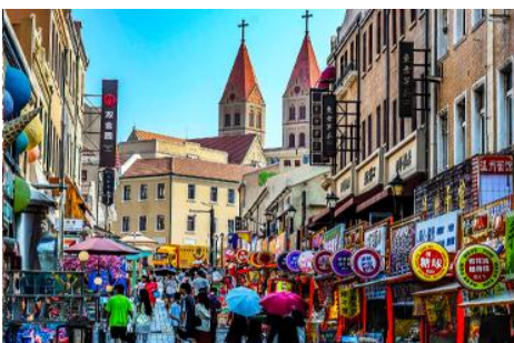
ถนนจงซาน

นำท่านเดินทางชม สะพานจ้านเจียว 栈桥 เป็นแลนด์มาร์กแห่งประวัติศาสตร์คู่เมืองชิงเต่า สร้างเมื่อปี ค.ศ.1891 มีลักษณะเป็นสะพานหินทอดยาวกว่า 440 เมตรสู่ทะเล ปลายสะพานมีศาลา ทรงแปดเหลี่ยมสีแดงที่โดดเด่น ซึ่งเป็นสัญลักษณ์บนฉลากเบียร์ชิงเต่า ขึ้นชื่อเรื่องวิวสวย รับลมทะเล ให้ท่านเก็บภาพบรรยากาศ