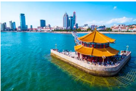
สะพานเจียนเจียว

หลังอาหารนำท่านสัมผัสสมนต์เสน่ห์ของหมู่บ้านชาวประมง ซาจื่อโจว 沙子口渔村 ให้ท่านได้ชมวิถีชีวิตดั้งเดิมกับทิวทัศน์ชายทะเล วิถีบ้านเรือนหลากสีที่ตั้งเรียงรายตามแนวชายฝั่งที่โดดเด่นด้วยเอกลักษณ์ ทำให้ หมู่บ้านซาจื่อโจว เป็นเอกลักษณ์เป็นจุดถ่ายภาพราวกับเมืองชายฝั่งของอิตาลีในยุโรป, จึงเป็นที่ดึงดูดให้นักท่องเที่ยวต่างอยากมาสัมผัสบรรยากาศ ณ หมู่บ้านชาวประมงซาจื่อโจวแห่งนี้