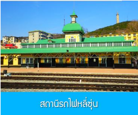
สถานีรถไฟหลี่ซุ่น

เรือท่องเที่ยวนำคณะเดินทางถึงท่าเรือเมืองต้าเหลียน นำท่านขึ้นรถบัสเพื่อเดินทางสู่ตัวเมืองต้าเหลียน รับประทานอาหารเช้า ณ ห้องอาหาร (7)