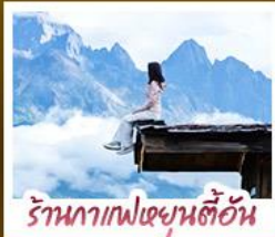
ร้านอาหารเป่ย์ซุนตันอัน

ชมวิวภูเขาหิมะสวยสุดโรแมนติกกับแสงยามพลบค่ำ เที่ยวเมืองโบราณต้าหลี่ ลี้เจียง ป่าชา แซงกรี่ล่า ชมวิถีชีวิตของชุมชนยูนนานและทิเบต พิสูจน์ความกล้าท้าเดินชมสะพานแก้วลี้เจียง • ซุปโปงเพลินที่ถนนคนเดินหนานผิงเจียง