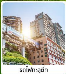
รถไฟฟ้าสุดึก