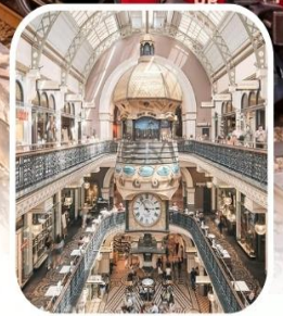
QUEEN VICTORIA BUILDING