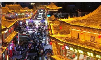
ตลาดกลางคืนจางเย่

*ทางบริษัทฯ ขอสงวนสิทธิ์ในการสลับโปรแกรมทัวร์ตามความเหมาะสมขึ้นอยู่กับสถานการณ์หน้างาน โดยคำนึงถึงผลประโยชน์ของลูกค้าเป็นสำคัญ