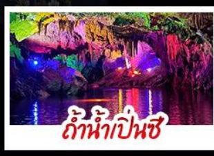
ถ้ำน้ำเป็นสี