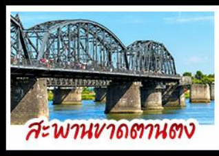
สะพานหวาดถานตง

2 มหัศจรรย์ธรรมชาติระดับโลก "หาดแดงผานจิน" คู่กับ "ถ้ำน้ำเป็นสี" ยืนมองฝั่งเกาหลีเหนือก็ตามตง • ชมความยิ่งใหญ่ของพระราชวังเส้นหยางกู่กุง