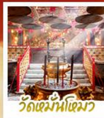
วัดมื่นไทมว