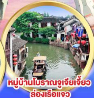
หมู่บ้านโบราณจูเจียเจี้ยว ล่องเรือแจว