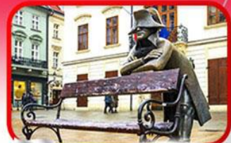
ย่านเมืองเก่าปราทิสลาวา

เที่ยวเมืองสวยริมทะเลสาบ ฮัลล์สตัดท์ • ชมเมืองไข่มุกแห่งโบฮีเมีย เซสกี กรุงลอน • ปราท • เวียนนา • ซอปปิงพาร์นดอร์ฟ เอาก์เล็ท