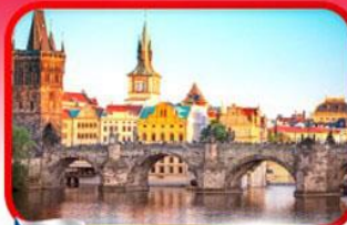
เขื่อนอินสพานชาร์ลส์