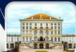
พระราชวังนิมเฟนบวร์ก