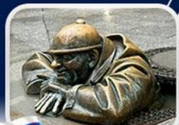
ประติมากรรม Cumil

มาเรียนพลาซซ์ • บ้านเกิดโมสาร์ท • พระราชวังฮอฟบวร์ก • ซาลส์บวร์ก • บ้านเกิดโมสาร์ท • เกรโกเดร์สตรีก • ทะเลสาบคอนิกซ์ • หมู่บ้านอัลล์สตัดท์ • อนุสาวรีย์มาเรียเทเรซา