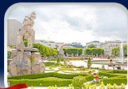
สวนมิราเบิล ซาลซ์บวร์ก