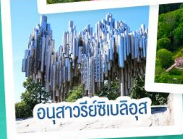
อนุสาวรีย์ซีเบลิอุส